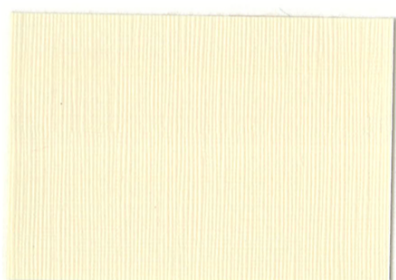
RE-01 △ 12 ＜アイボリー＞