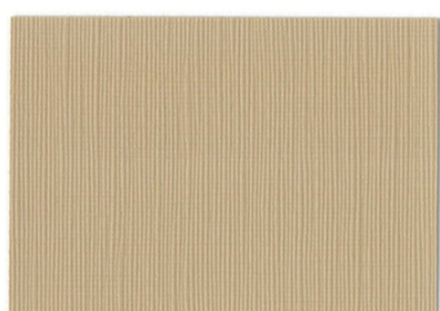
RE-03 △ ○ ＜ページュ＞