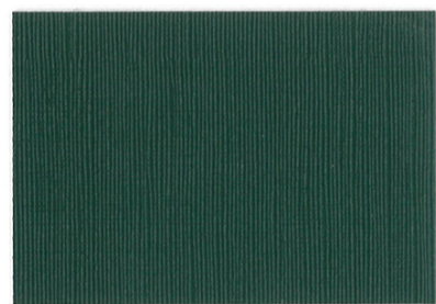
RE-07 △ ○ ＜ダークグリーン＞