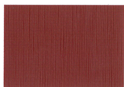
RE-05 △ 1 ＜バーガンディ＞