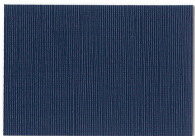
RE-06 △ ○ ＜ネイビー＞