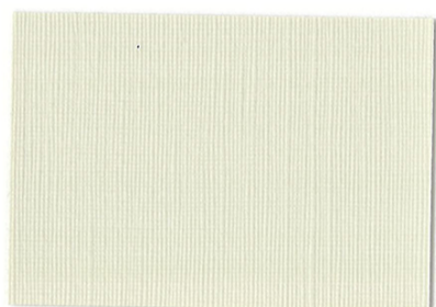
RE-02 △ 3 ＜バニラ＞